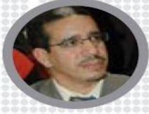
Fas Teçhizat ve Lojistik Bakanı Abdülaziz Rabbah:

"Türkiye halkı, demokrasinin ve hükümetin yanında yer alarak vatanına sahip çıktı. Darbeciler büyük hayal kırıklığı yaşadı. Halk, liderlerine sahip çıktığı zaman mucizeler meydana getirerek ülkenin istikrarını ve güvenliğini sağlayabiliyor. Allah'ım ümmetimizi, vatanımızı ve yurdumuzu koru."