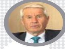
Avrupa Konseyi Genel Sekreteri Thorbjørn Jagland:

Pakistan, Türkiye halkı ve hükümeti ile dayanışma içerisinde. Türkiye'deki halkın iradesi ile oluşan demokratik sistemi ve demokratik yollardan seçilmiş liderliği destekliyoruz. Pakistan, demokrasi ve hukukun üstünlüğünü yıkma girişimini kinamaktadır. Pakistan halkı ve hükümeti, Türkiye'de huzurun en kısa zamanda tesis edileceğini ümit etmektedir."