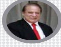
Pakistan Başbakanı Navaz Şerif:

"Türkiye halkı, demokrasinin ve hükümetin yanında yer alarak vatanına sahip çıktı. Darbeciler büyük hayal kırıklığı yaşadı. Halk, liderlerine sahip çıktığı zaman mucizeler meydana getirerek ülkenin istikrarını ve güvenliğini sağlayabiliyor. Allah'ım ümmetimizi, vatanımızı ve yurdumuzu koru."